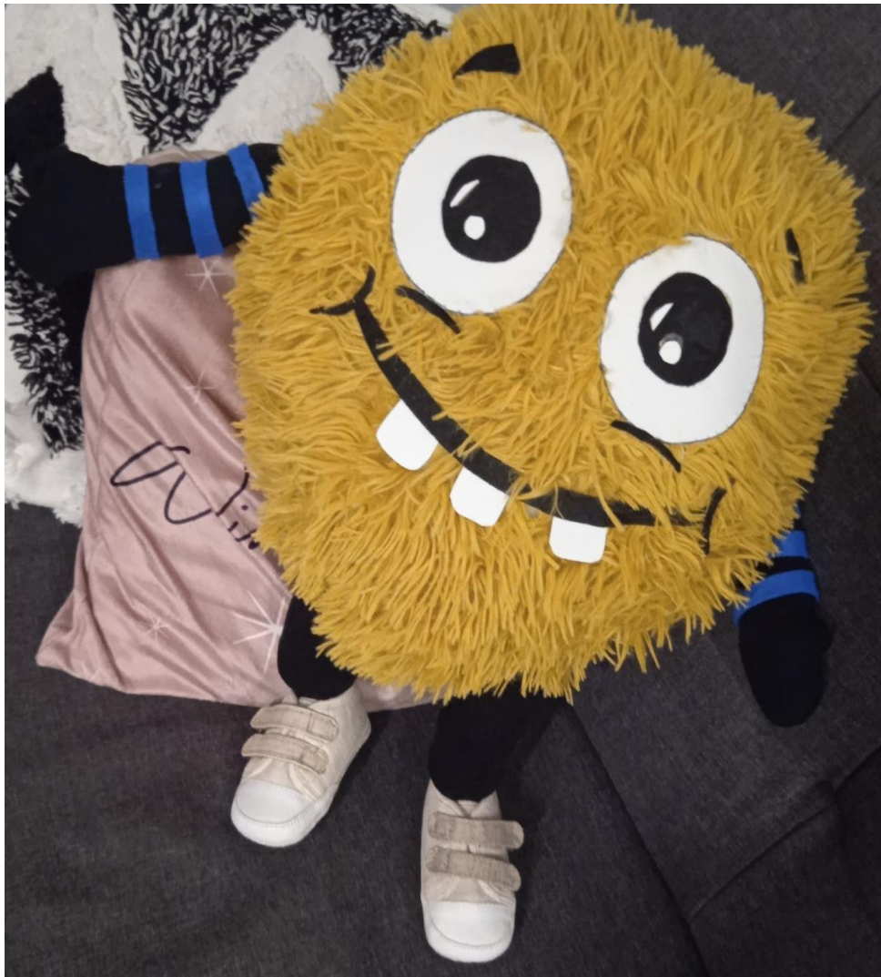
Maskotka motywacyjna „Pochwałobieracz”